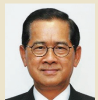
ナロンチャイ・アクラサニー

『21世紀のアジア・太平洋経済』 ナロンチャイ・アクラサニー (経済学博士/元タイ王国エネルギー・商務大臣)