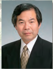
兵庫県立大学大学院 減災復興政策研究科長・教授 室崎 益輝