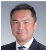
三重県知事 鈴木 英敬