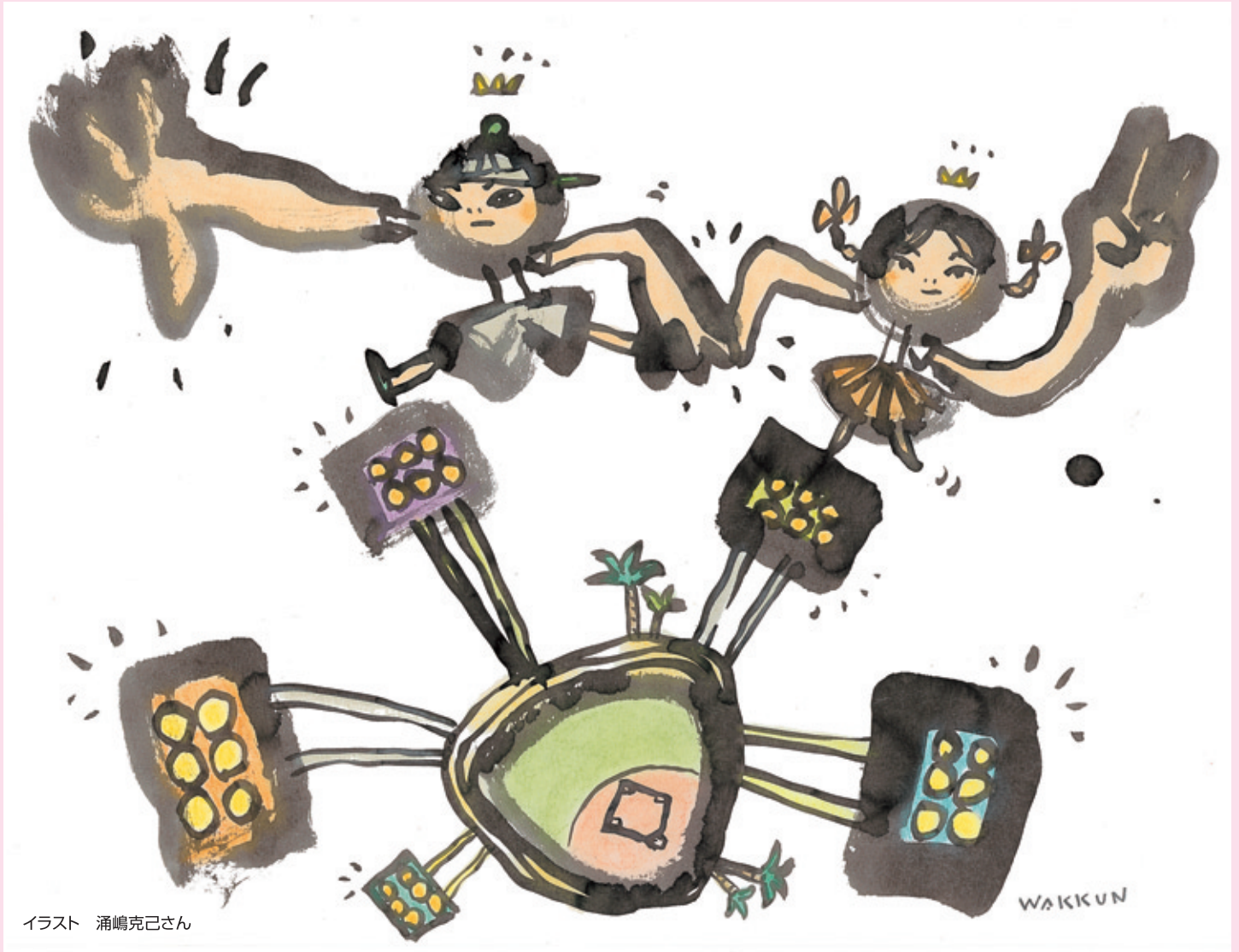
イラスト 涌嶋克己さん