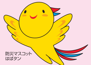
防災マスコット ほぼたん