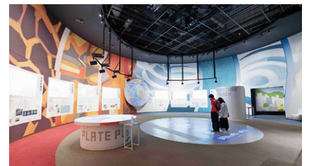
ジオ&スカイホール