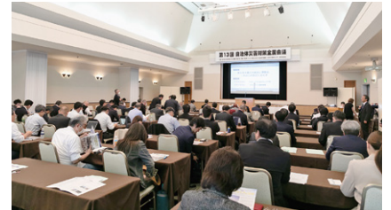
自治体災害対策全国会議