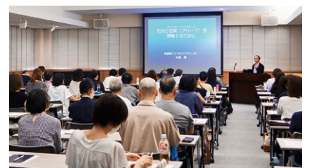
ヒューマンケア実践・普及講座